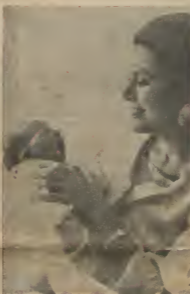
Primo foto di e priemo mas habon di Mazona. — Eñal ta e primo foto oficial di priemo Stephan na, seno cuñer dia des pues di su nomenamto. Ta e foto di seno chikito di e pariba real di Mo- non. Aruba e gualto priemo Gordo cu Ste- phanus den boma den sena politico na Mazona

Tocante e situacion deba- rita den e club di AVB nos por agrega asina cu eñal ta un di e personan mas du- den trabao cu e directiva tin cu trece na bida, y ya nos por aprecia cu algo a ser laca pa aliva e situ- cion aki. AVB e taca un- rita cu ta corta solamente un boma pa chera y cu ta ofrece como premio — 1. Dos pasabi ida y vuelta pa Puerto Rico cu TCA mas 100 dollar pa gasta. 2. Un pasabi ida y vuelta pa Co- lumbus cu Aerocarinas mas 40 dollar pa gasta. Aki no solamente e apuntes di nos futbol y di nos depor- tividad di poeta nan ayudo, sino tambe eña e oportu- nidad di sali di vacacion cu pasabi gratis, eñal ta e promision di dicta sifu. Pero fuera di eñal AVB den un enorme necesidad